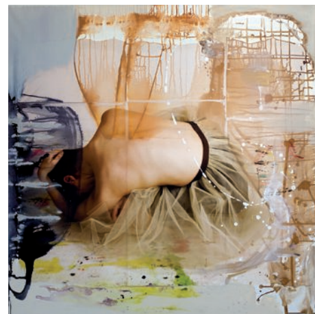
Portrait of a Dancer III, 120 x 120 cm