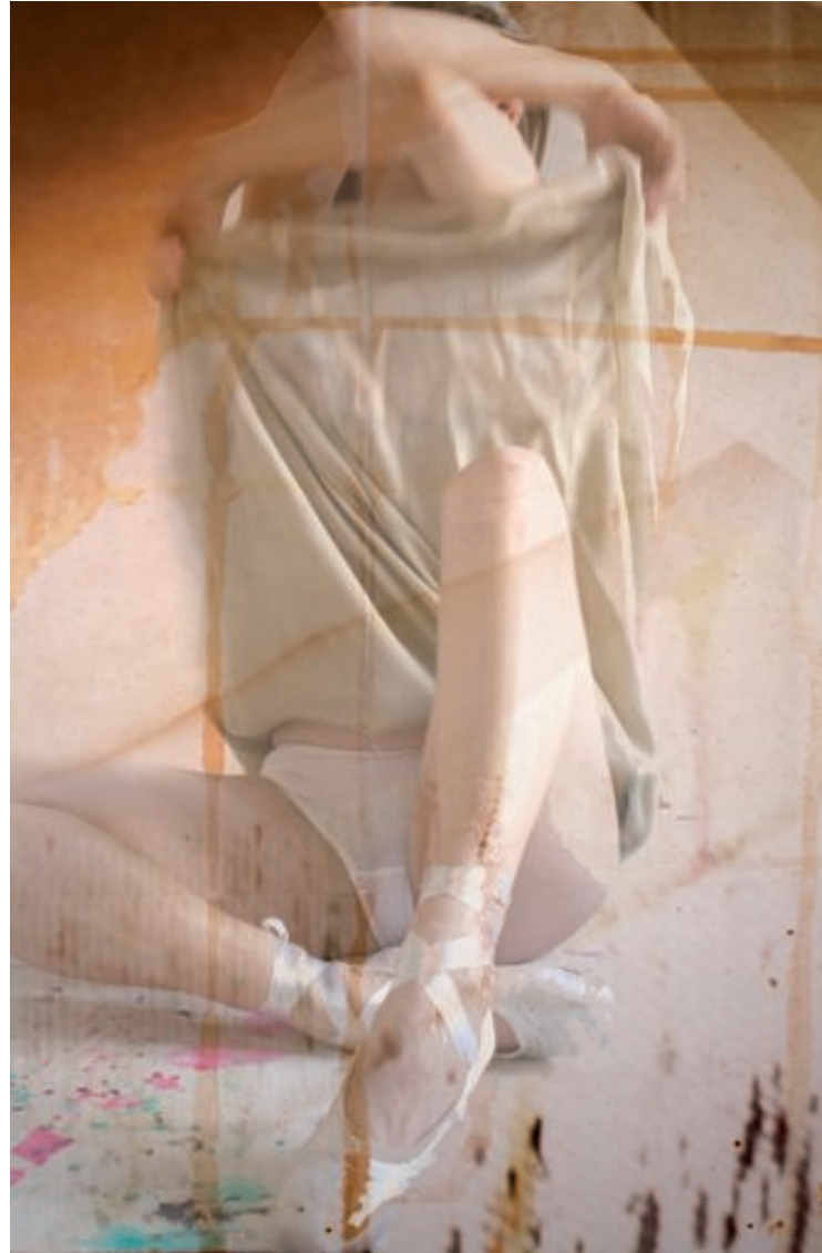
Decompress, 40 x 60 cm