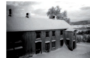
Galleri Maria Veie, distriktsavdeling