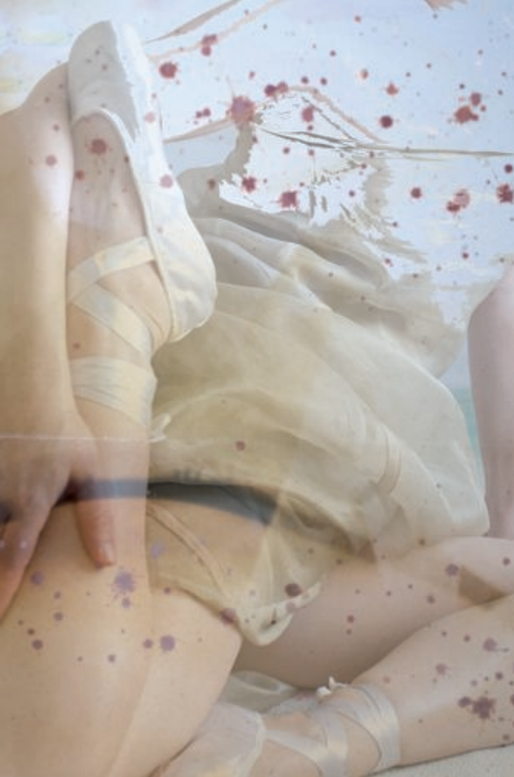
Decompress, 40 x 60 cm